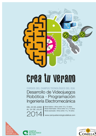
Foto: Cartel generico del Campus 2014