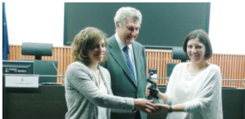
Foto: Entrega del Premio Avizor 2013 en la Sala Clara Campoamor del Congreso de los Diputados

http://embed.bambuser.com/channel/CIECODE