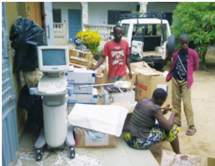
Foto: Llegada del Ecógrafo a Benín