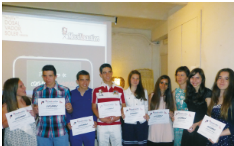
Foto: Entrega de premios III Edición Movilisaction

http://unmundosalvadorsoler.org/movilisaction/ganadores2014.aspx