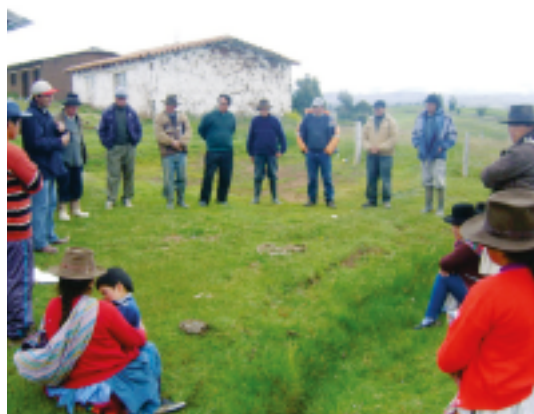
Foto: Reunión de acompañamiento a productores de hongo

Para el logro de este fin, el programa se orienta a la formación en capacidades empresariales y productivas a través de talleres, promoción de ferias, equipamiento y acompañamiento. En estas actividades se busca respetar y revalorar el patrimonio cultural y propiciar la igualdad de oportunidades de género.