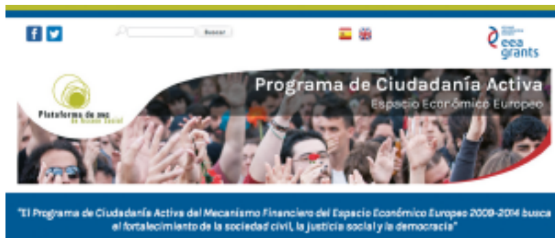
Foto: Portada de la web de ciudadanía activa