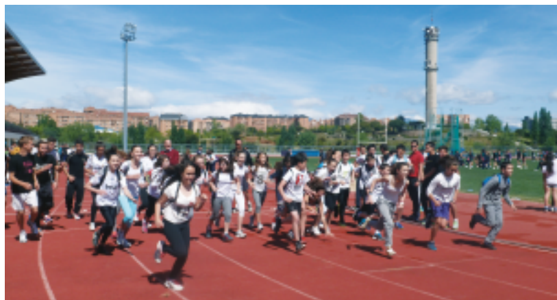
Carrera Solidaria por Benín

https://www.youtube.com/watch?v=Xa89rgce-j4&feature=youtu.be